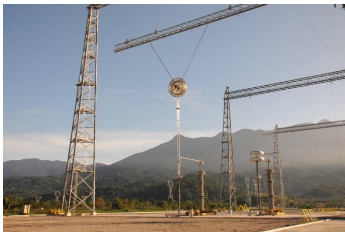
Foto 9 – Vista geral do Laboratório de UAT Externo (Montagem de arranjo de ensaios)