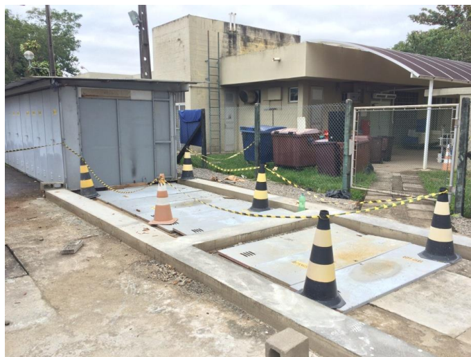
Foto 18 – Desmontagem dos cubículos antigos e preparação da base dos novos equipamentos. Atividade nº 14.1 – SEADRI (Cubículos)