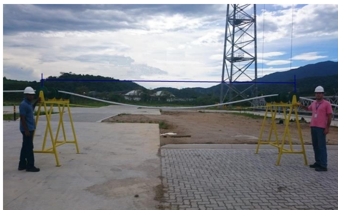
Foto 10 – Roletes utilizados na movimentação de cabos durante a montagem para os ensaios no Lab. UAT Externo. Atividade nº 9 – Roletes