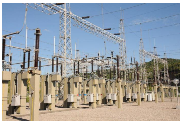
Foto 24 – Novas chaves seccionadoras monopolares da SE 138 kV. Atividade nº 14.2 – SEADRI (Seccionadoras)