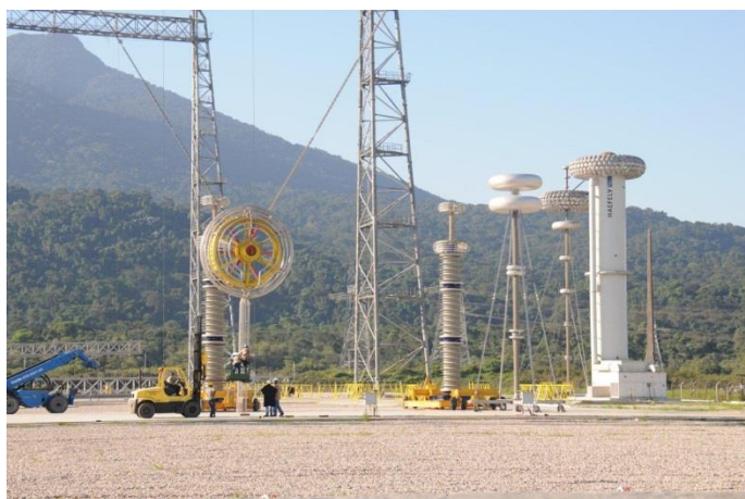
Foto 8 – Início da montagem do arranjo de ensaios no Laboratório de Ultra Alta Tensão Externo.