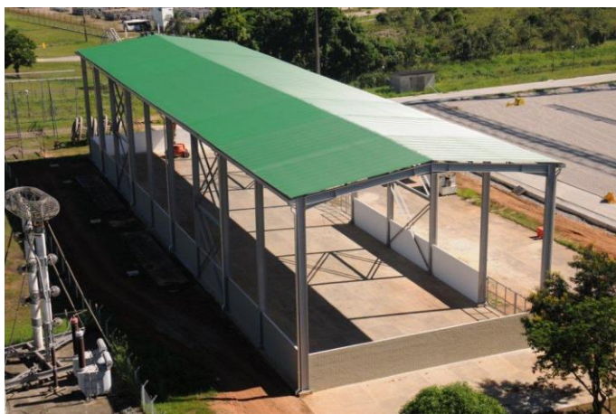
Foto 6 – Montagem do galpão (Galpão concluído) Atividade nº 4 - UATPORT