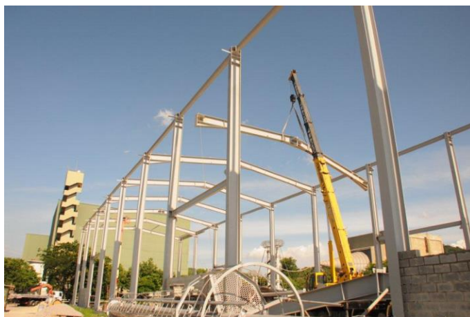
Foto 3 – Montagem do galpão (instalação das travessas) Atividade nº 4 - UATPORT