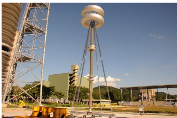
Foto 13 – Capacitor 1200 kV (KKFO 1200-2 DC) Atividade nº 5 - UATCEF