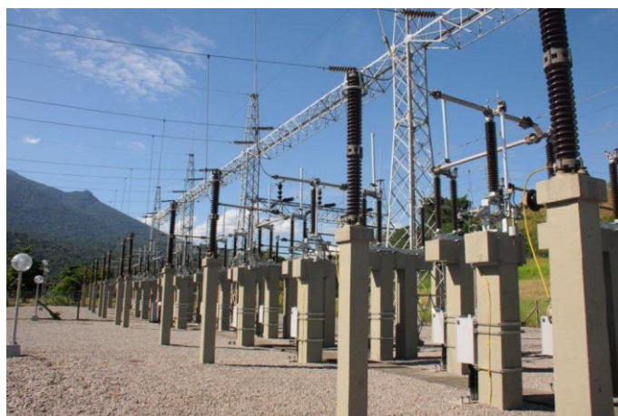
Foto 23 – Novas chaves seccionadoras monopolares da SE 138 kV. Atividade nº 14.2 – SEADRI (Seccionadoras)