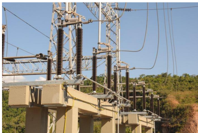
Foto 20 – Novas chaves seccionadoras tripolares da SE 138 kV. Atividade nº 14.2 – SEADRI (Seccionadoras)