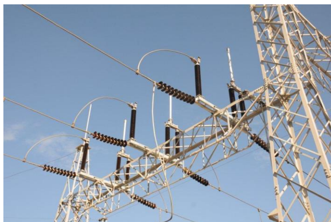
Foto 21 – Nova chave seccionadora de interligação da SE 138 kV. Atividade nº 14.2 – SEADRI (Seccionadoras)