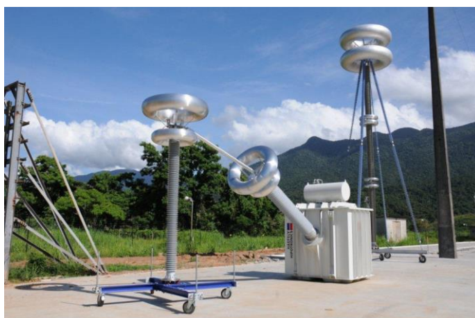
Foto 14 – Transformador de 500 kV e divisor de tensão (PSKO 500-500-60) Atividade nº 5 - UATCEF