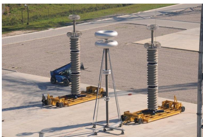
Foto 12 – Carreta utilizada para deslocamento do retificador de 1000 kVCC utilizado nos ensaios no Lab. UAT Externo. Atividade nº 6 – Yoke e Carreta