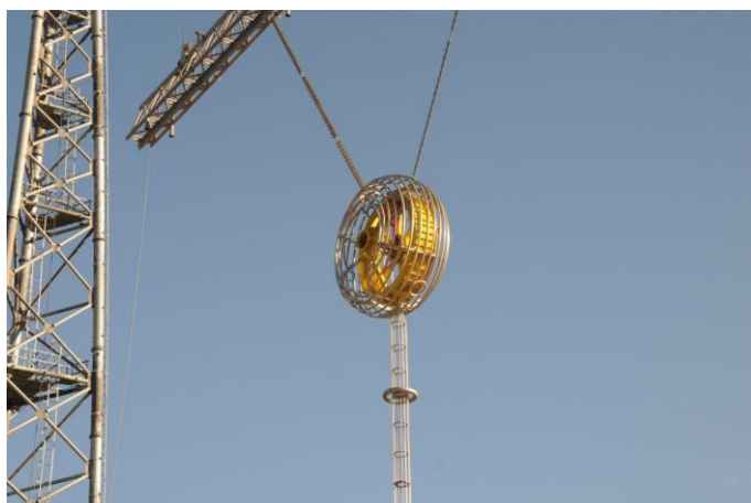
Foto 11 – Yoke utilizado na montagem do arranjo de ensaios no Lab. UAT Externo. Atividade nº 6 – Yoke e Carreta