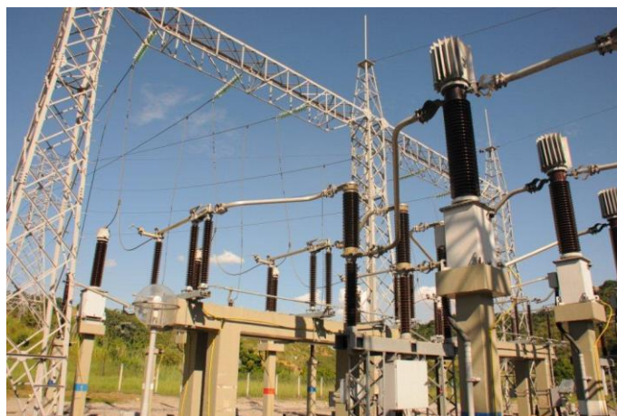
Foto 22 – Novas chaves seccionadoras tripolares da SE 138 kV. Atividade nº 14.2 – SEADRI (Seccionadoras)