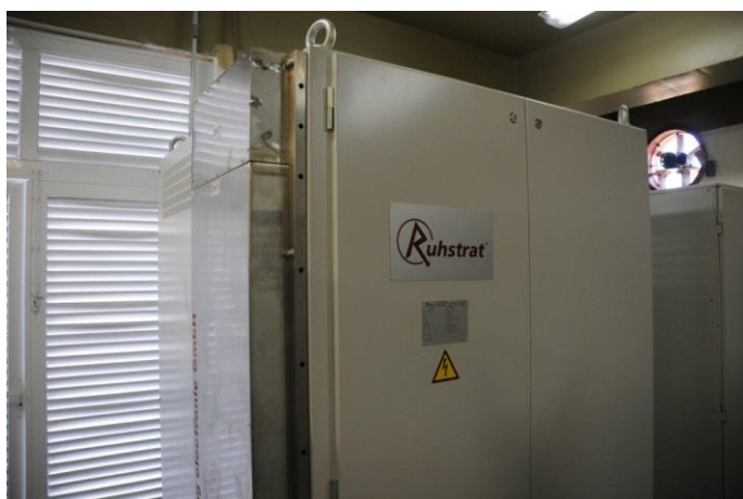
Foto 15 – Painel de alimentação do transformador (PSKO 500-500-60) Atividade nº 5 - UATCEF