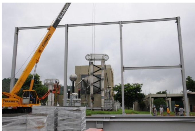
Foto 2 – Montagem do galpão (instalação das travessas) Atividade nº 4 - UATPORT