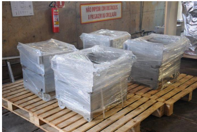
Foto 17 – Chegada dos Cubículos em Adrianópolis Atividade nº 14.1 – SEADRI (Cubículos)