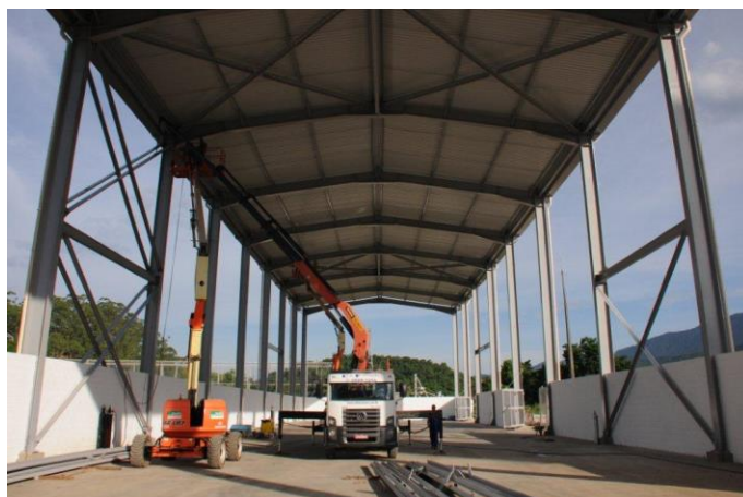
Foto 5 – Montagem do galpão (instalação da amarração lateral) Atividade nº 4 - UATPORT