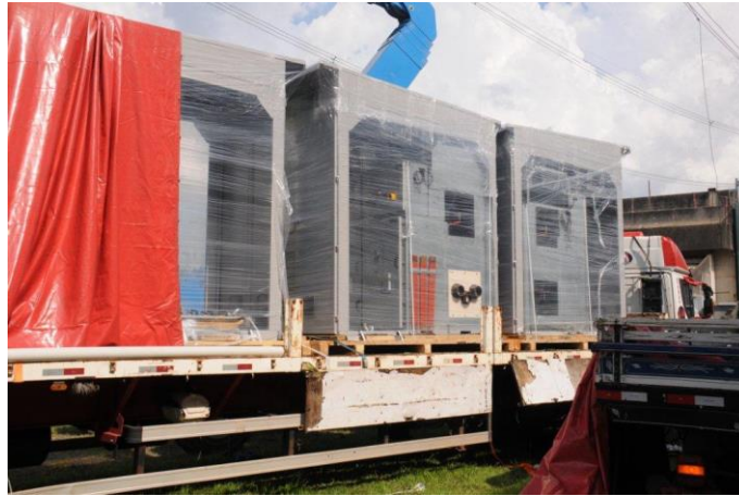
Foto 16 – Chegada dos Cubículos em Adrianópolis Atividade nº 14.1 – SEADRI (Cubículos)