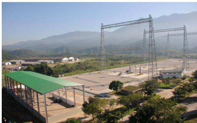
Foto 7 – Vista geral do Laboratório de Ultra Alta Tensão Externo, após conclusão das obras e instalação dos Pórticos. Atividade nº 4 - UATPORT