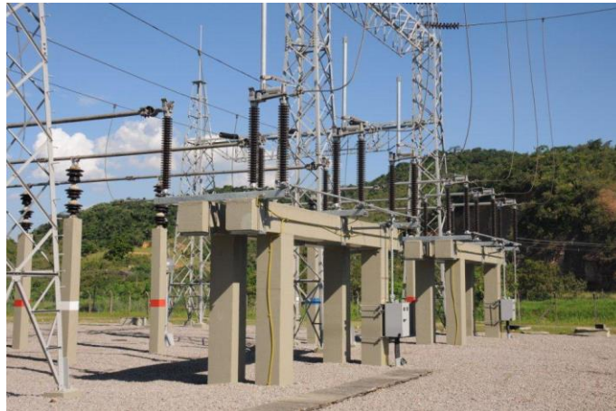
Foto 19 – Novas chaves seccionadoras da SE 138 kV. Atividade nº 14.2 – SEADRI (Seccionadoras)