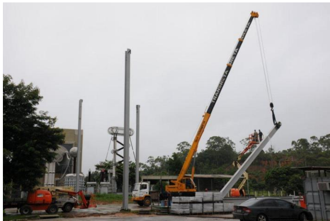
Foto 1 – Montagem do galpão (instalação dos pilares) Atividade nº 4 - UATPORT